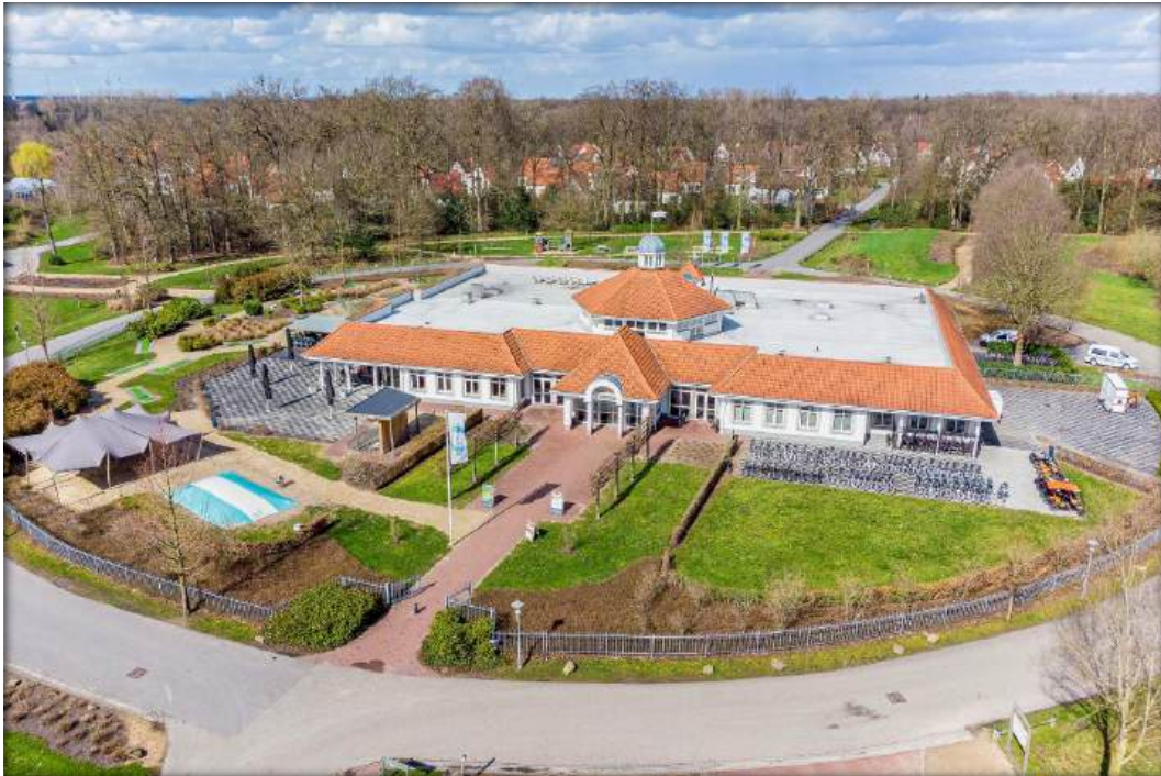
Het centrumgebouw is uitgerust met een Food Market, restaurant en verschillende sport- en spelactiviteiten.

Direct tegenover het park kunt u terecht in het gemeentelijke overdekte zwembad met kinderbad en het buitenbad met diverse speelmogelijkheden.